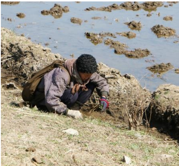
(Ehető élelmet keres valaki Észak-Koreában)

Az elmúlt években az OpenDoors azt tapasztalta, hogy a keresztyénüldözés gyakran családon belül, vagy a szomszédok és a falusi közösségek részéről valósult meg. Ezt a jelenséget is üldözésként kell felfogni, mivel az üldözést elszenvedő szempontjából teljesen mindegy, hogy ki az üldözés megvalósítója. Ráadásul ezekben az esetekben egy keresztyénellenes állam rendszeresen nem avatkozik be - sem karhatalommal, sem pedig a felelősség későbbi kivizsgálásával. A nemzetközi jog szerint minden ilyen esetben is egyértelmű az államhatalom felelőssége.